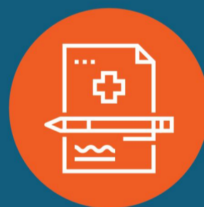
Выписка справок, направлений