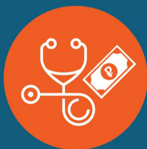
Оплата диагностических процедур